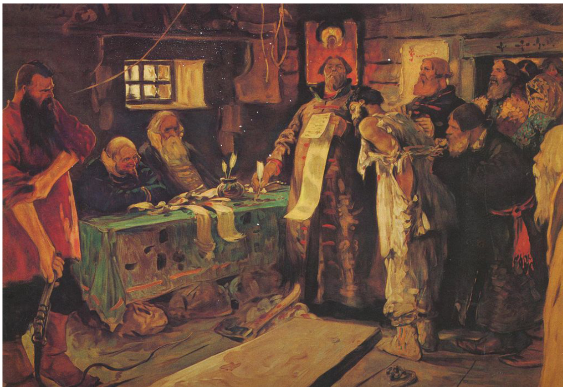
С. В. Иванов. «Суд в Московском государстве»