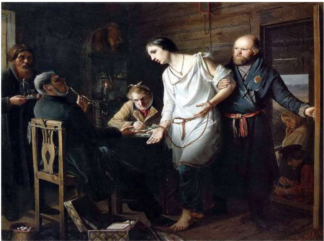
В. Г. Перов. «Приезд станового на следствие»