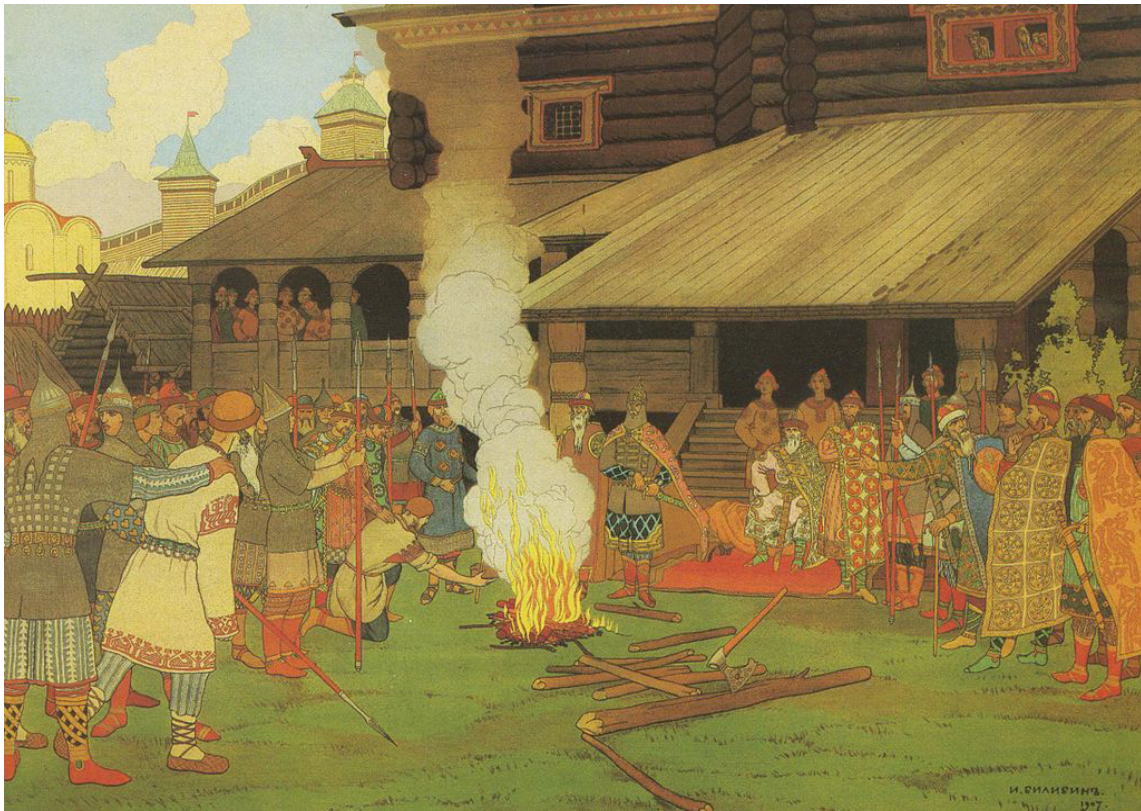
И. Билибин. «Суд во времена Русской Правды»