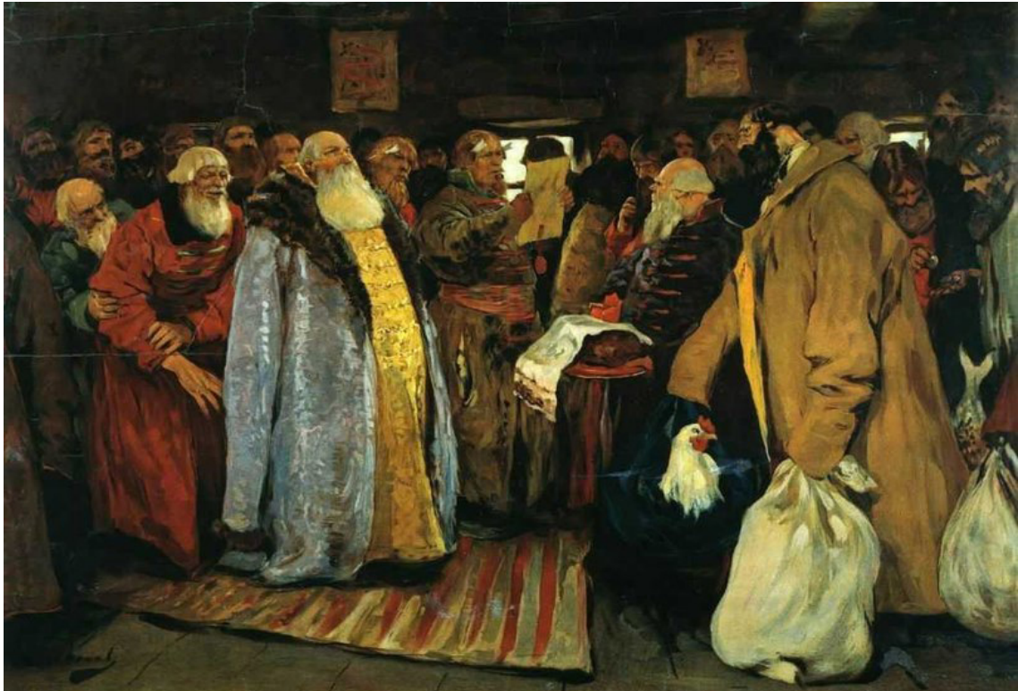
С. В. Иванов. «Приезд воеводы»